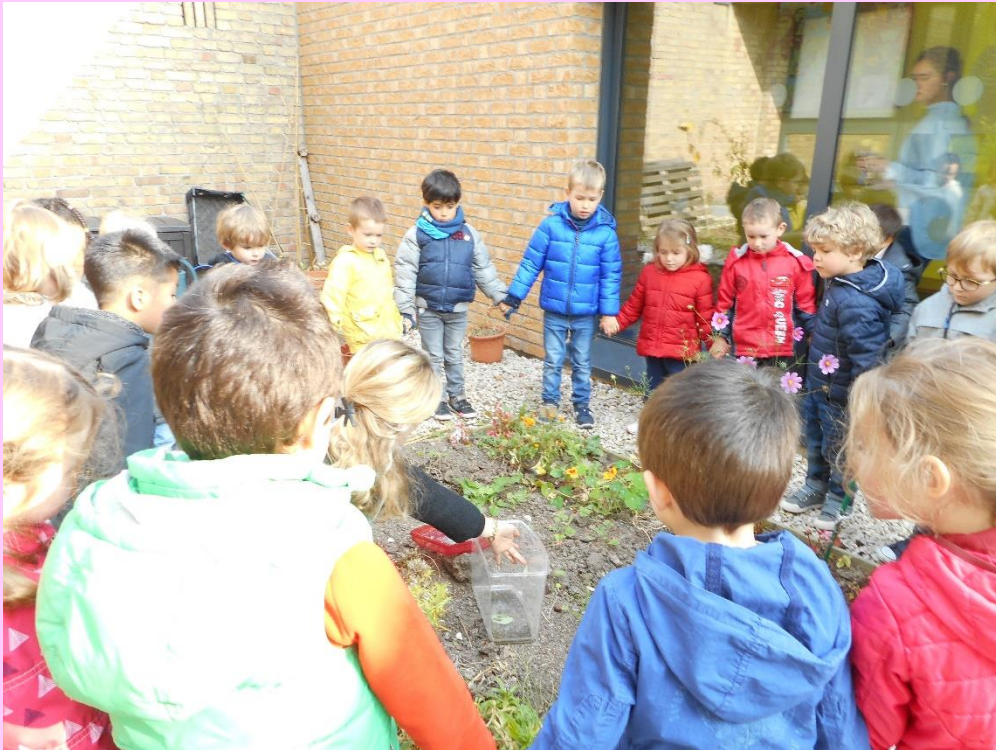
LE LÂCHER DES PAPILLONS