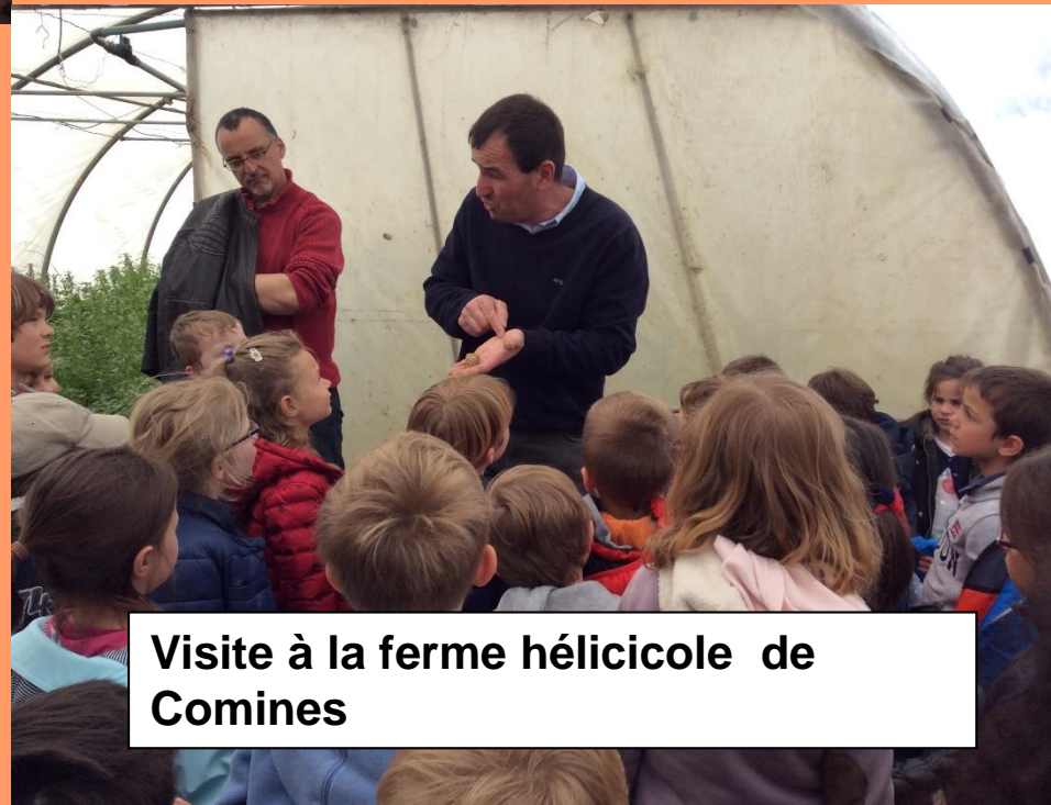
Visite à la ferme hélicicole de Comines